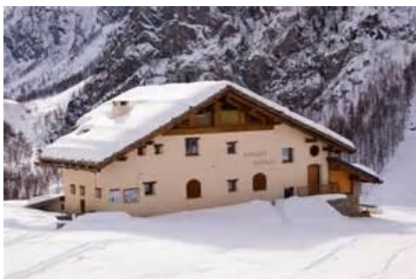
Il Rifugio Troncea