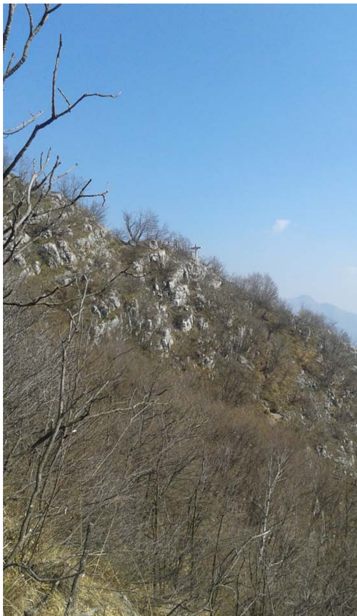
La croce di vetta all'arrivo della ferrata del Medale

Parcheggiata l'auto al cimitero di Rancio, oppure appena oltre il paese, si segue l'indicazione per la "Ferrata del Medale" (circa 30/40 minuti di avvicinamento).