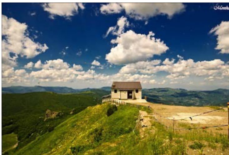
Il monte Bue

Escursione proposta da: Valerio Spairani 335-7064804 Silvia Cazzola 328-2424833