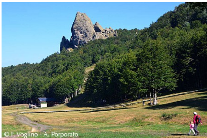
Il pianoro del Prato della Cipolla

Il Lago Nero è ubicato in una conca racchiusa tra il Monte Nero, da cui il nome, e il Monte Bue. E' la zona più alta del piacentino. L'itinerario scelto è volutamente allungato dall'ascesa al Monte Bue, consigliabile per ammirare il panorama dai 1771 mt della vetta. A fondo valle è Santo Stefano d'Aveto, poi lo sguardo corre dal vicino Maggiorasca a vallate liguri a perdita d'occhio, alla Val Boreca, alla catena del Crociglia e del Carevolo fino all'Aserei e all'Osero. Se la giornata è propizia si può vedere un'ampia fetta di mare.