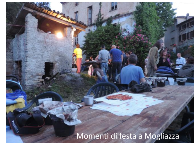
Momenti di festa a Mogliazza

Per coloro che interverranno solo alla escursione di domenica mattina: raggiunta Torrazza Coste proseguono sul lato sinistro della Osteria del Campanile scendono nel valloncetto e risalgono al Maresco (evidente torretta) proseguono dritti al bivio e scendono tre tornanti sino alla provinciale della Val Schizzola dove all'incrocio svoltano a destra. Si prosegue sempre sulla provinciale superando la esse di Pragate tralasciando a sinistra il bivio per Casa Vescovo /Borgo Priolo ma proseguendo dritti in direzione Schizzola. Superata Cascina S.Pietro rallentare, dopo una curva appare all'improvviso sulla destra la strada per S.Antonino/Mogliazza. Salire i vari tornanti sino ad uno più evidente con un portico diroccato, svoltare a destra per Mogliazza e procedere adagio. Arrivati alla frazione seguire strada asfalto a sinistra e le indicazioni per l'ombreggiato parcheggio.