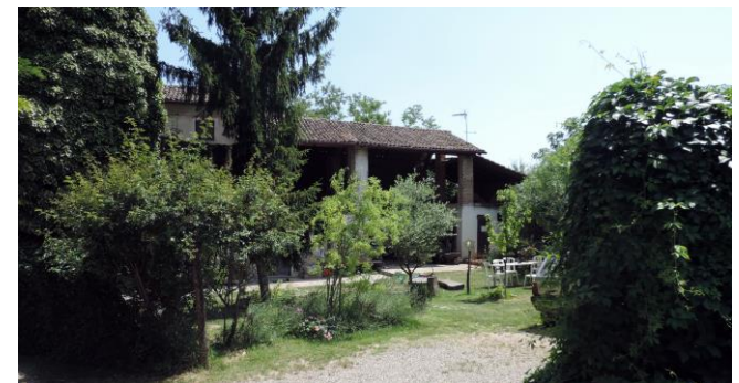
la cascina che ci ospiterà per la cena