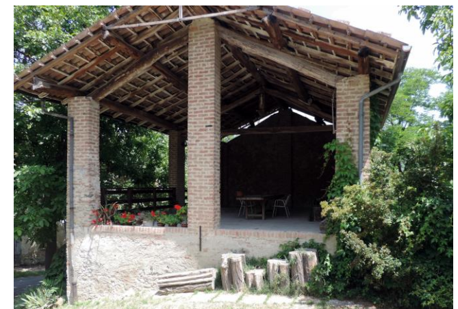
il portico per chi preferisce non dormire sotto le stelle