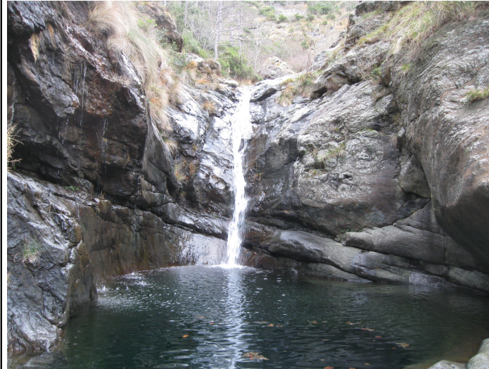
Lago della Tina "marmitta dei giganti" e pentole minori

EEA = Escursionismo Esperti, itinerario attrezzato