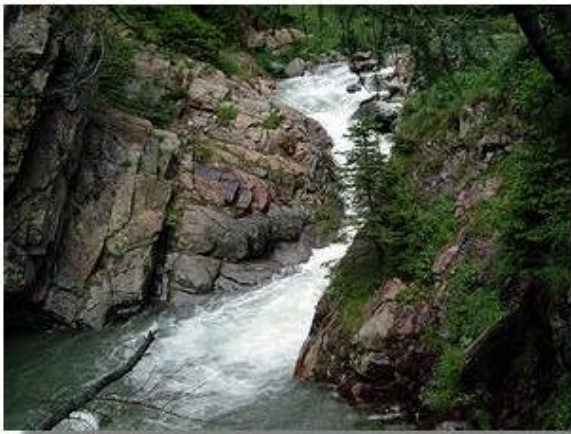
un tratto delle gole

Al termine escursione, per coloro che vogliono trattenersi, breve visita a Madesimo.