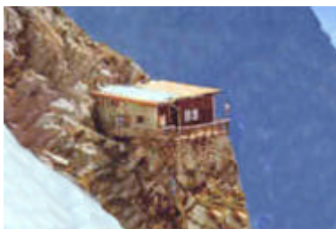
Il Rifugio Boccalatte

Casello autostradale di Courmayeur. Proseguire per la Val Ferret sino a Planpincieux. Si oltrepassa il centro abitato parcheggiando nel grandissimo spiazzo a sinistra che si incontra appena dopo le ultime case.